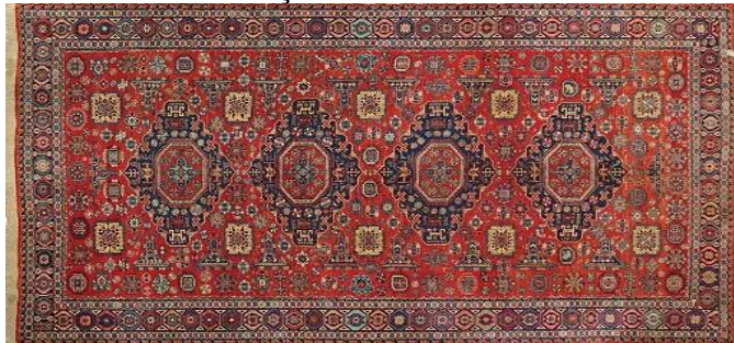
Şəkil 5. Sumax

keçiriləndən sonra ,sadə arğac ipi sonra yenidən digər çin keçirilir.Sumax xalçalarının ən geniş yayılmış yeri istehsalat mərkəzi Şırvan zonasıdır.Əsasən bu möhtəşəm xalçalar Şamaxıda toxunulur. Həmçinin bu xalçalar Cənubi Azərbaycan, Qarabağ, Naxçıvan bölgəsində geniş yayılmışdır. Sumax bədii tərtibatında Şırvan xalçalarının kompozisiyaları geniş istifadə olunur (Şəkil 5). Sumaxlar əsasən məişətdə divarların dekorasiyası və ya yerliklər kimi istifadə olurdu. Alimlərin fikirlərinə görə bu xalçaların ən çox yaygın olduqları Şırvan qrupunun Şamaxı zonası ilə adı səciyyələndirilir. Sonralar isə bu xalçaları Azərbaycanın başqa bölgələrində də hətta sərhədlərindən kənarında da, Şimali Qafqazda toxunmağa başladı. Sumaxların ən gözəl nümunəsi Məxfur xalçasıdır.