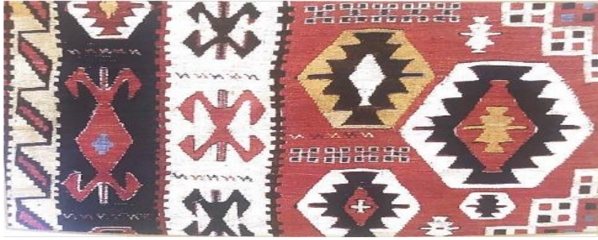
Şəkil 4. Kilim

Şırvan xalçalarında sumax və zili texnikası ilə toxunan xalçalar digər qruplardan öz zəriflikləri ilə çox-çox fərqlənirdilər. Başlıca şərt materialın yumuşaqlığıdır. Bu xovsuz xalçalar tərəkəmələrin həyatında önəmli rol oynayırdı. İnsanlara əsas olaraq yüngül, rahat daşınılan və dözümlü xalçalar lazım idi. Oturaq həyat sürən insanlara isə zərif parça kimi gözəl xalçalara üstünlük verirdilər. Sumax xalçaları yundan ayrılmış iplərdən toxunulur. Xovsuzların ən zərifi bu xalçalar idi. Şırvan qrupu kimi heç bir qrupda bu qədər zərif olmurdu. Sumax toxunan zaman üç müxtəlif iplərdən istifadə olunur. Bu iplər əriş, ərqaç və naxışlar üçün istifadə edilən iplərdir. Naxış ipləri ərişlərə mürəkkəb dolama ilə yəni “sarıma dolama” və ya “halqalı dolama” yolu ilə yaranır. Toxunan zaman sünbülvari düzülüş yaranıb ərişlərin üzərini örtür. Hər bir çin