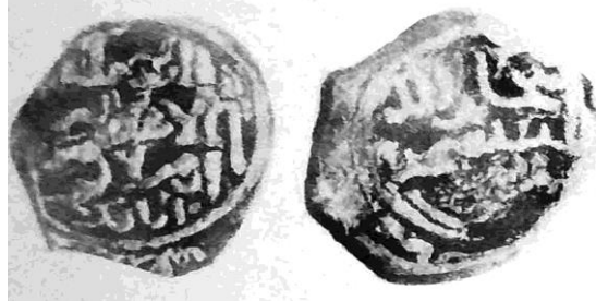
Şəkil 1. NF 16. Şəms əd-Din Eldəniz (1136 - 1175), Təbriz, 9 q, bilon dirhəm

Eldənizlər dövrünə aid sikkələr respublikamızın müxtəlif bölgələrində (Bakı, Beyləqan, Şamaxı, Xankəndi, Ağdam, Bərdə, İmişli, Gəncə və Naxçıvan MR) Əhar məlikləri, şirvanşah-Kəsrənilər, Səlcuqilər, Dərbənd məlikləri, Danişməndilər, Zəngilər, Öyyubilər, Xarəzmşahlar, Baqratilər və Bizans sikkələri ilə birgə aşkarlanmışdır. Məhz bu tapıntılar uyğun dövrün ticarət əlaqələrini büruzə verir.