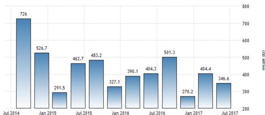
Graphic 1. Investment flow to Georgia in 2014-2017